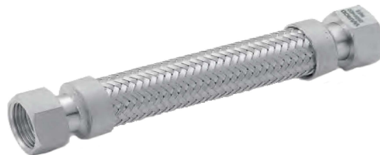
B型 (一端活动螺母一端固定内螺纹)