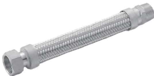
A型 (一端活动螺母一端固定外螺纹)